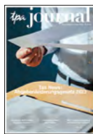
TPA Journal-Abo 3 mal jährlich wichtige Hintergrundinfos