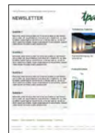
TPA E-Mail Newsletter